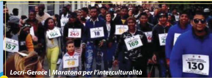
Locri-Gerace | Maratona per l'interculturalità