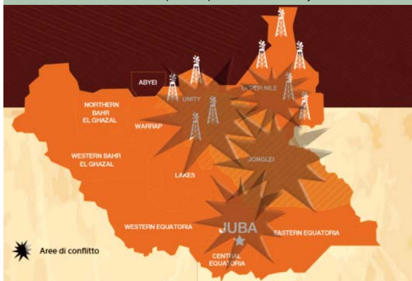
Aree di conflitto e pozzi di petrolio

A inizio 2016 la situazione è però ancora sospesa, con continui rinvii alla formazione del Governo transitorio di Unità nazionale che verrà ufficialmente dichiarato alla fine di aprile. In questi mesi intanto gli attacchi da entrambe le parti continuano, mantenendo il Paese ancora in una situazione di insicurezza generalizzata.