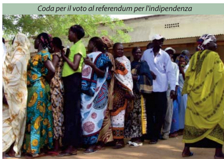
Coda per il voto al referendum per l'indipendenza

Tra giugno e luglio 2013 il conflitto per il controllo del potere tra i due principali leader politici, apre la crisi politica. Il presidente Salva Kiir, di etnia dinka, revoca due ministri e successivamente il vicepresidente Riek Machaar, di etnia nuer, oltre a diversi personaggi chiave dell'esercito. La divisione di lunga data tra dinka e nuer, le due principali etnie del Sud Sudan, fanno gioco ai due leader per trasformare il conflitto politico in scontro etnico.