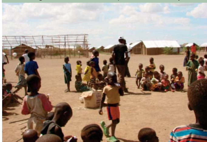
Profughi sudsudanesi nel campo di Kakuma (Kenya)

Nessuna misura per il disarmo o il reintegro dei combattenti è stata finora accennata, nonostante la dichiarata volontà da parte del governo di istituire un tribunale